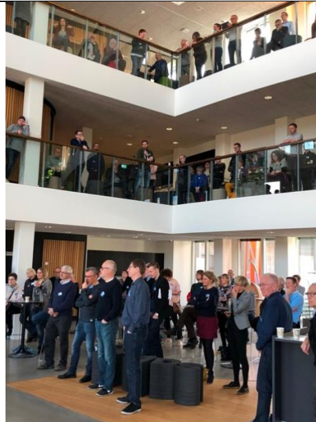
Gentæn Skjern Kick off dag på Innovest.