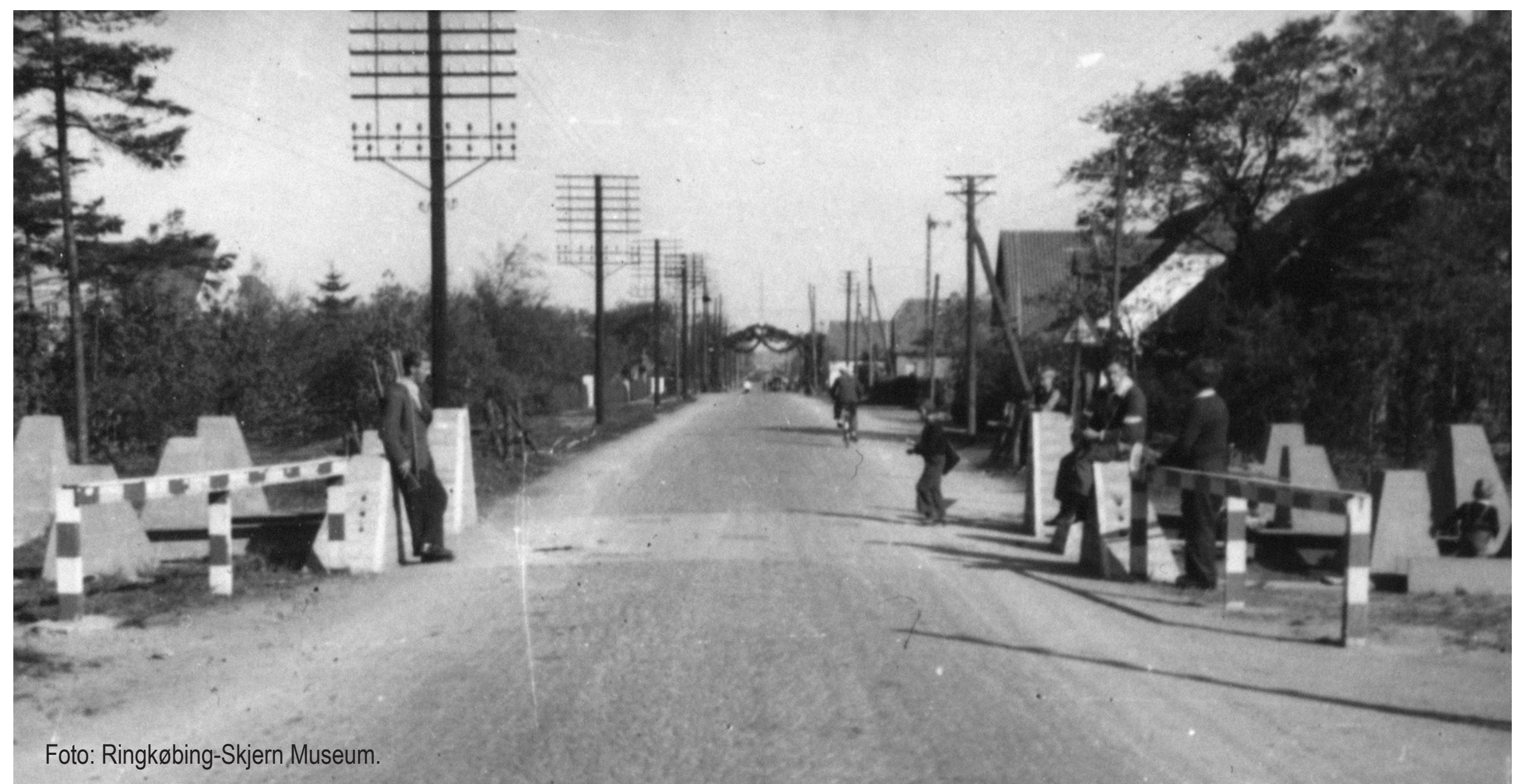
Lignende spærring ved udmundningen af Birkallé i Vardevej set mod nord. I baggrunden æresport klar til modtagelse af de allierede tropper.

Pansergraven blev anlagt under 2. verdenskrig i 1944 med et 5,9 km langt forløb rundt om Skjern. Graven var ca. 4 m bred og havde en dybde på ca. 2 m. Ved de vigtigste veje ind i byen var der bygget kontrolposter i beton, omgivet af de såkaldte "dragetænder". Efter krigen blev pansergraven dækket til på nær strækningen ved Stampebæk i den nordlige del af byen.