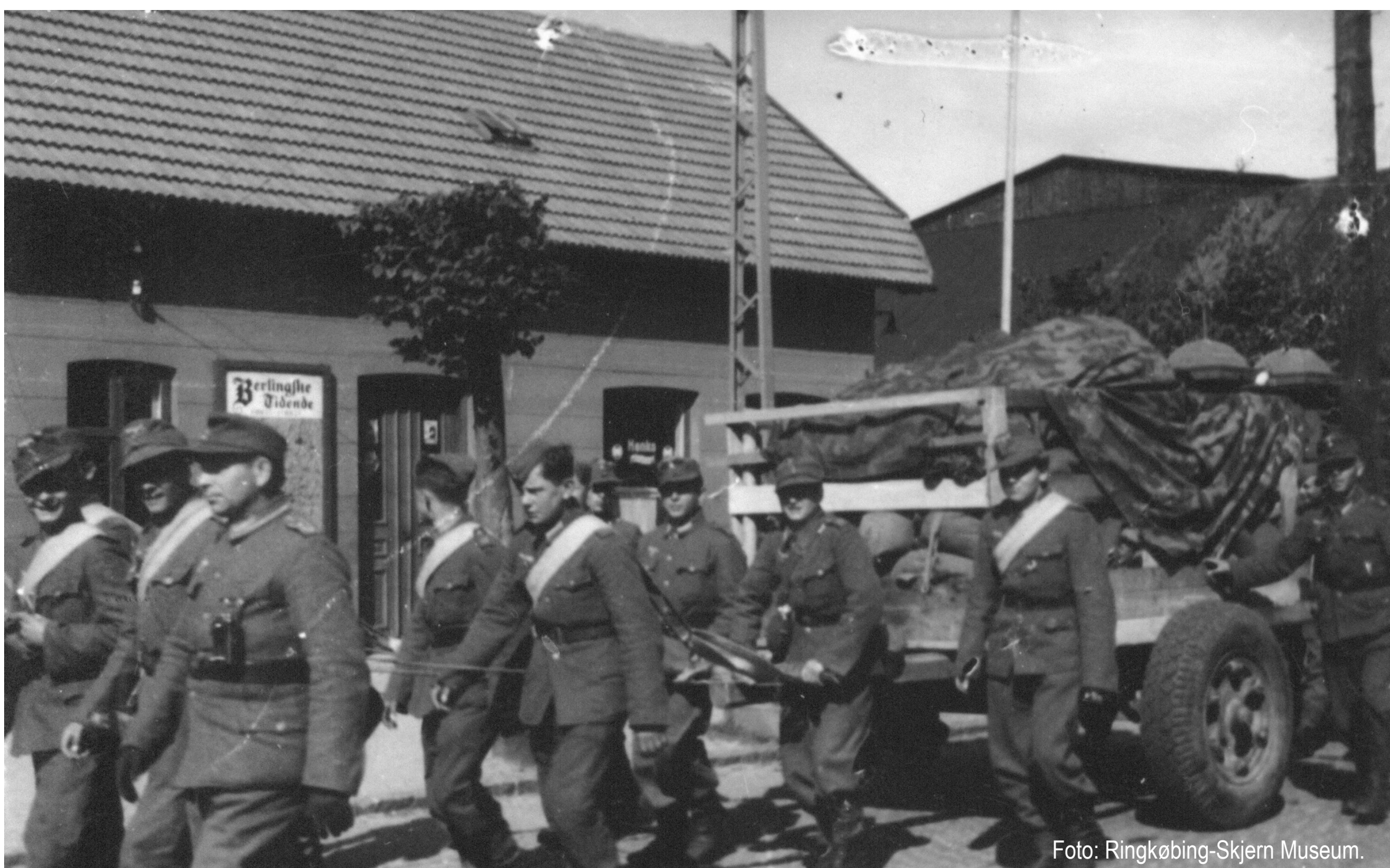
Tyskerne vandrer hjem efter befrielsen 5. maj 1945.

Pansergraven i Skjern udgjorde en del af Hitlers Atlantvold. Den skulle forhindre de allieredes kampvogne i at trænge ind i trafikknudepunktet Skjern.