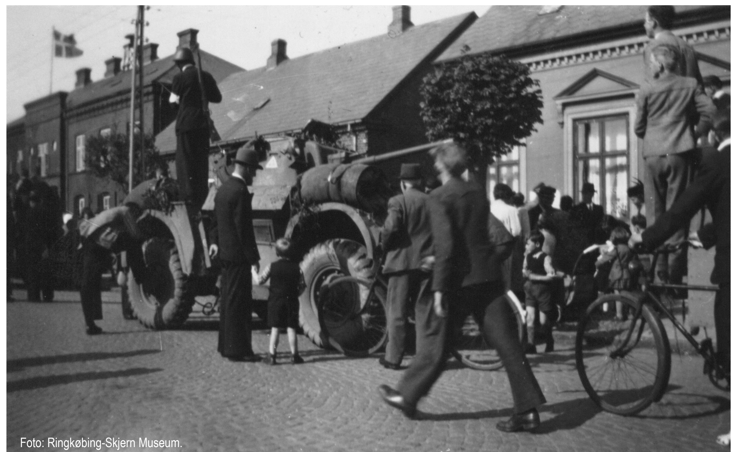
De første engelske tropper ankommer til Skjern.