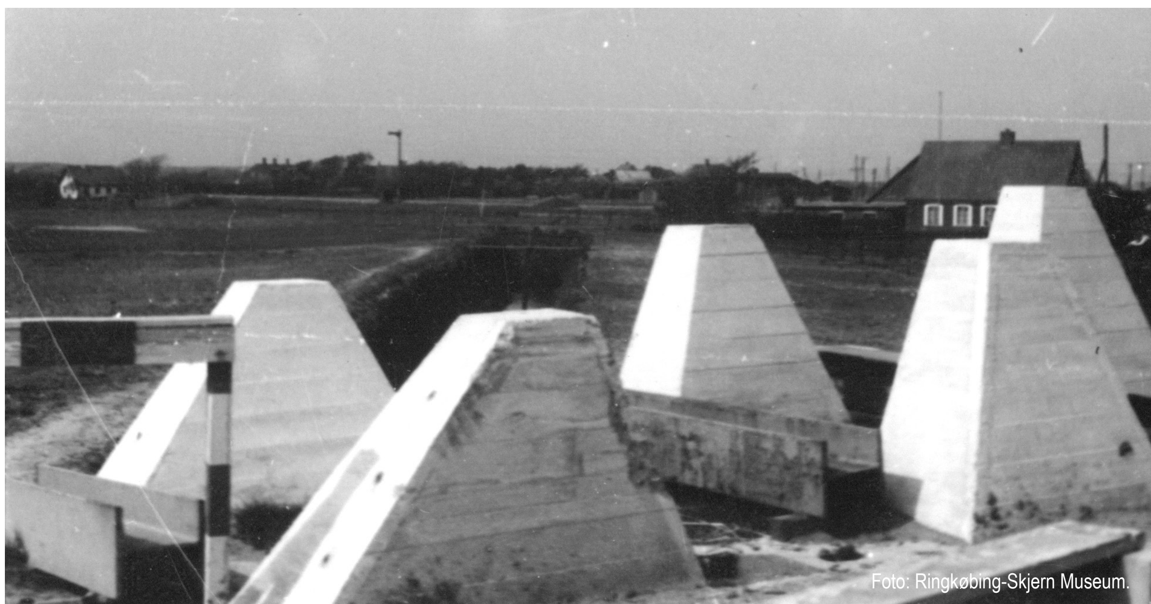
Spærring med "dragetænder" og bom over Vejle set mod nord. I baggrunden ses graven og et stuehus opført i 1894 (Vejle nr. 23).